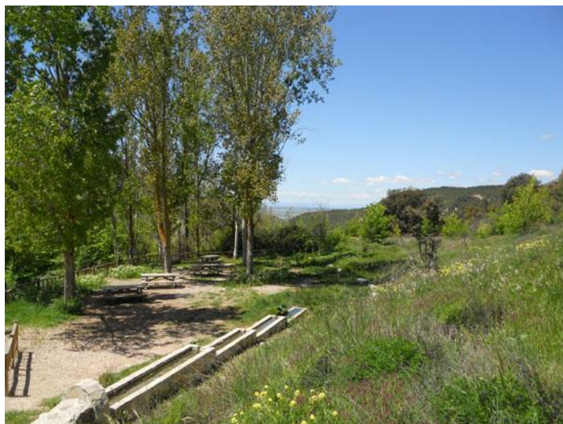
Fuente y merendero en las inmediaciones de Chiloeches.