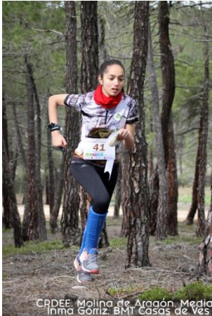
CRDEE, Molina de Aragón, Media Inma Górriz, BMT Casas de Ves

Los representantes de las provincias, que previamente se habían clasificado tras unas fases provinciales bastante duras, especialmente en lo meteorológico, se enfrentaron a unos trazados exigentes tanto en el "Pinar de Molina" (media y larga distancia) como en el casco urbano de esta histórica ciudad señorial (Sprint).