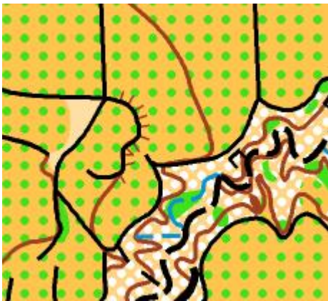
EJEMPLO MAPA SAN ANTÓN 1:5000