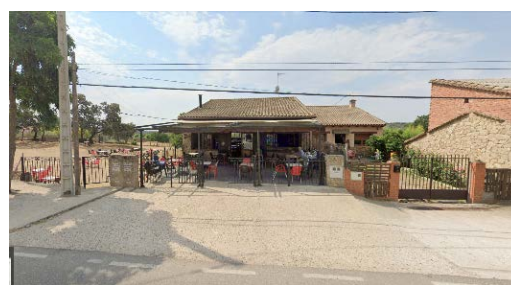
Centro de Competición Bar Amigo - Google Maps

Estará situado en el Bar “AMIGO” de Pelahustán (Toledo). UBICACIÓN: CM-5005 nº 64 / 40.17791, -4.59472