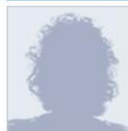
Imagen de usuario